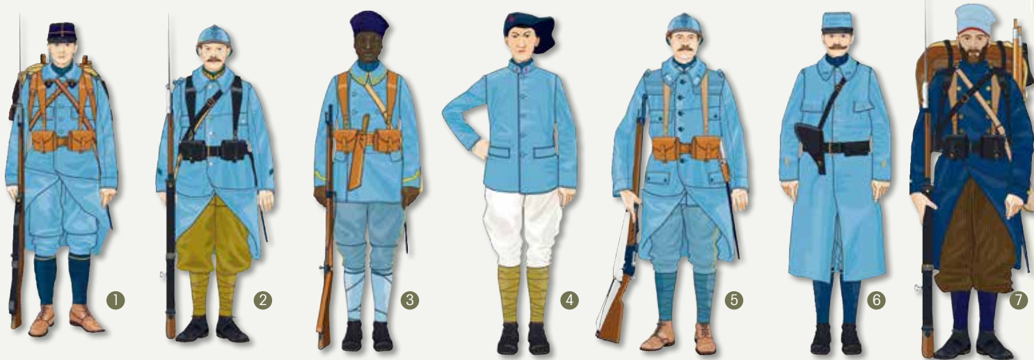
1 - Chasseur à pied début 1915

La tenue connue sous le nom de « bleu horizon » commence à revêtir les troupes à partir du milieu de 1915.