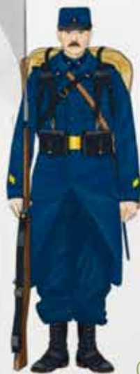
Chasseur à pieds

Samedi 1 er août 1914 – il fait chaud – Chauvé, 1777 habitants est tout à l'ouvrage, les agriculteurs sont en pleine moisson. Il faut profiter du beau temps pour faucher le blé, le battre et engranger les précieuses récoltes dans les greniers. Le front perlé de sueur, la chemise trempée, les hommes d'un geste sûr coupent les tiges chargées d'épis. Les charrettes cahotent dans les chemins, tirées par le cheval, les bœufs ou les vaches, les enfants jouent, rient, les femmes traient les vaches ou préparent le repas ; soudain dans l'après-midi, des tintements de cloches venus du bourg. Le tocsin ? Le feu ? Ou ça ? On monte sur les pailers, on cherche une fumée.... Rien. Voilà que le clocher du Clion s'en mêle, puis c'est au tour de St Père, d'Arthon, de la Sicaudais. Une mère dit à sa fille : enlève le grelot du cheval, on est en deuil !!!